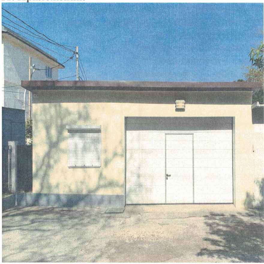
Фотография №1-главный фасад.