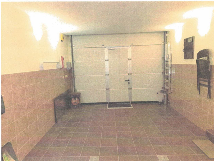
Фотография №4 .