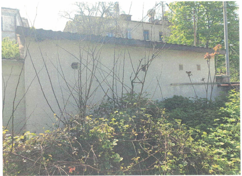
Фотография №2- дворовой фасад.